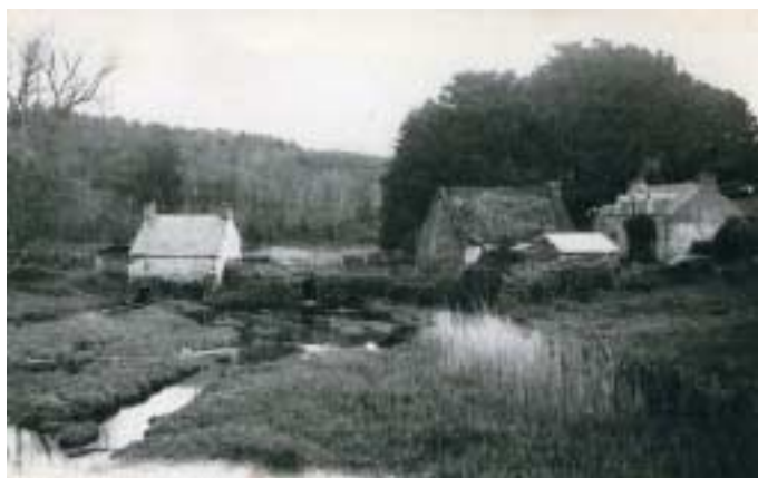
Trébabu - le moulin d'en bas Vilin-izella